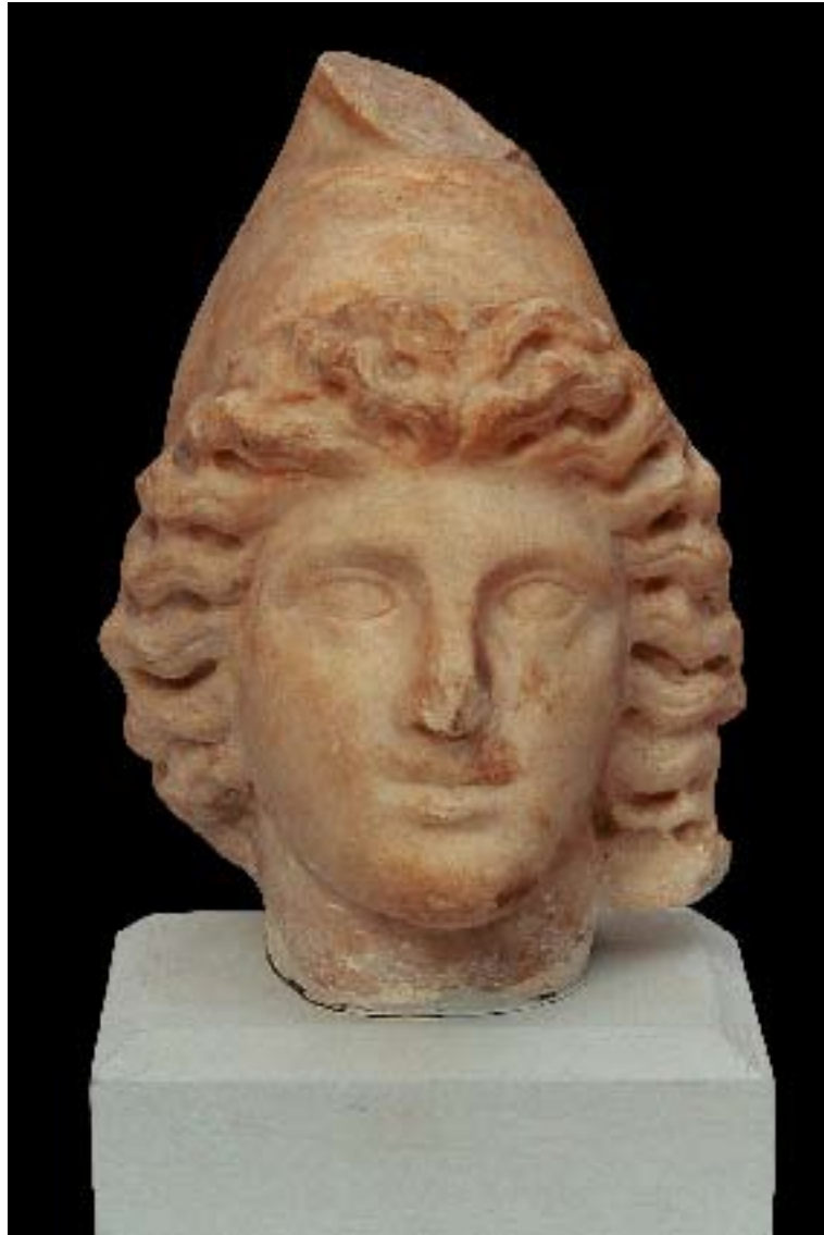
Head in marble Registration no. 18573