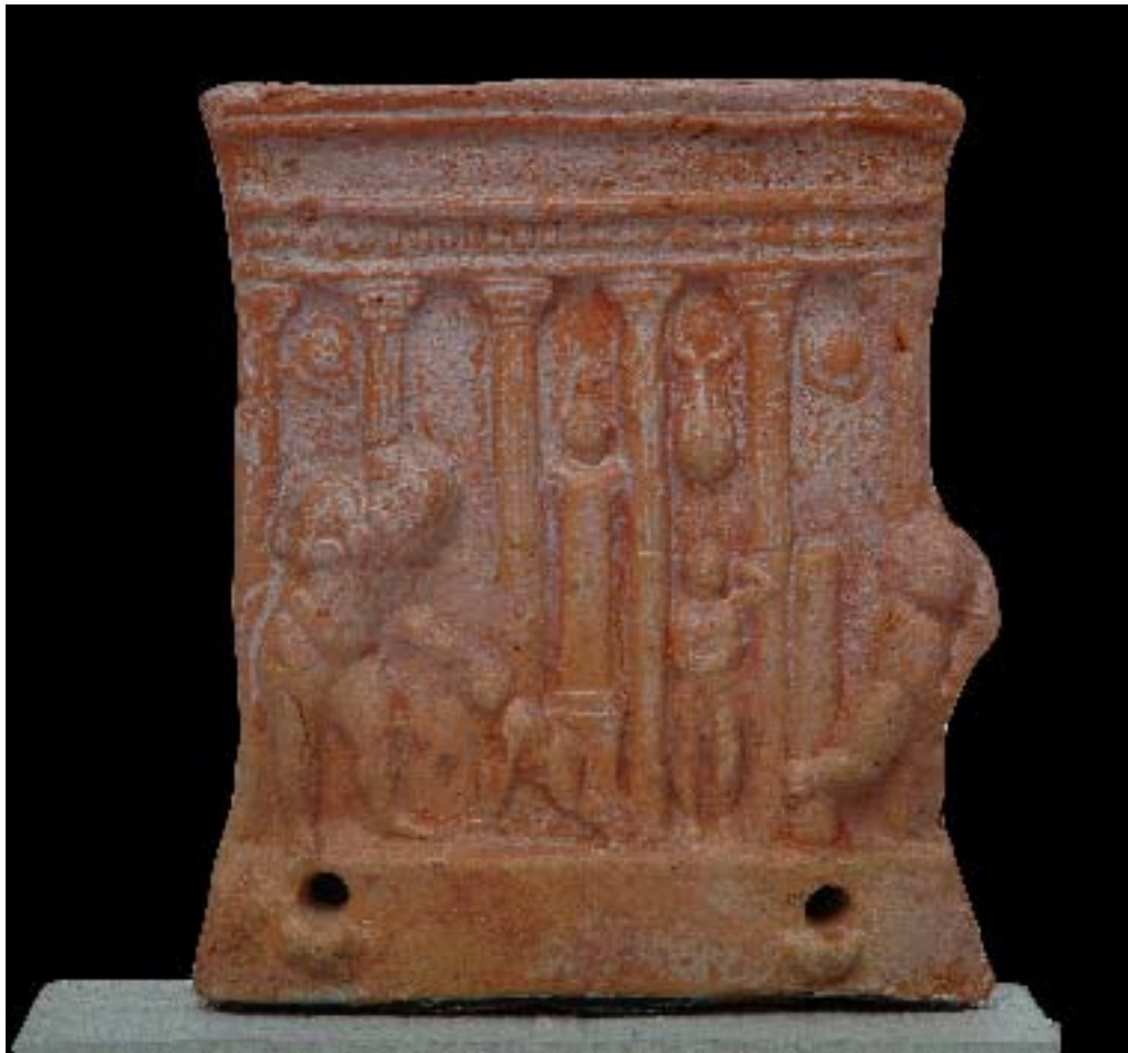
Lamp in terracotta Registration no. 18755