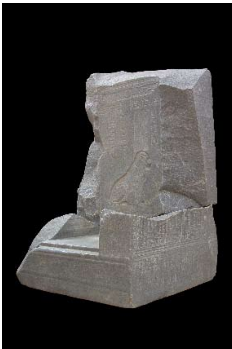
Fragment in marble representing the Egyptian calendar Registration no. 25774