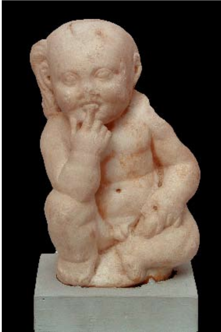
Marble statue of Harpocrate Registration no. 18572