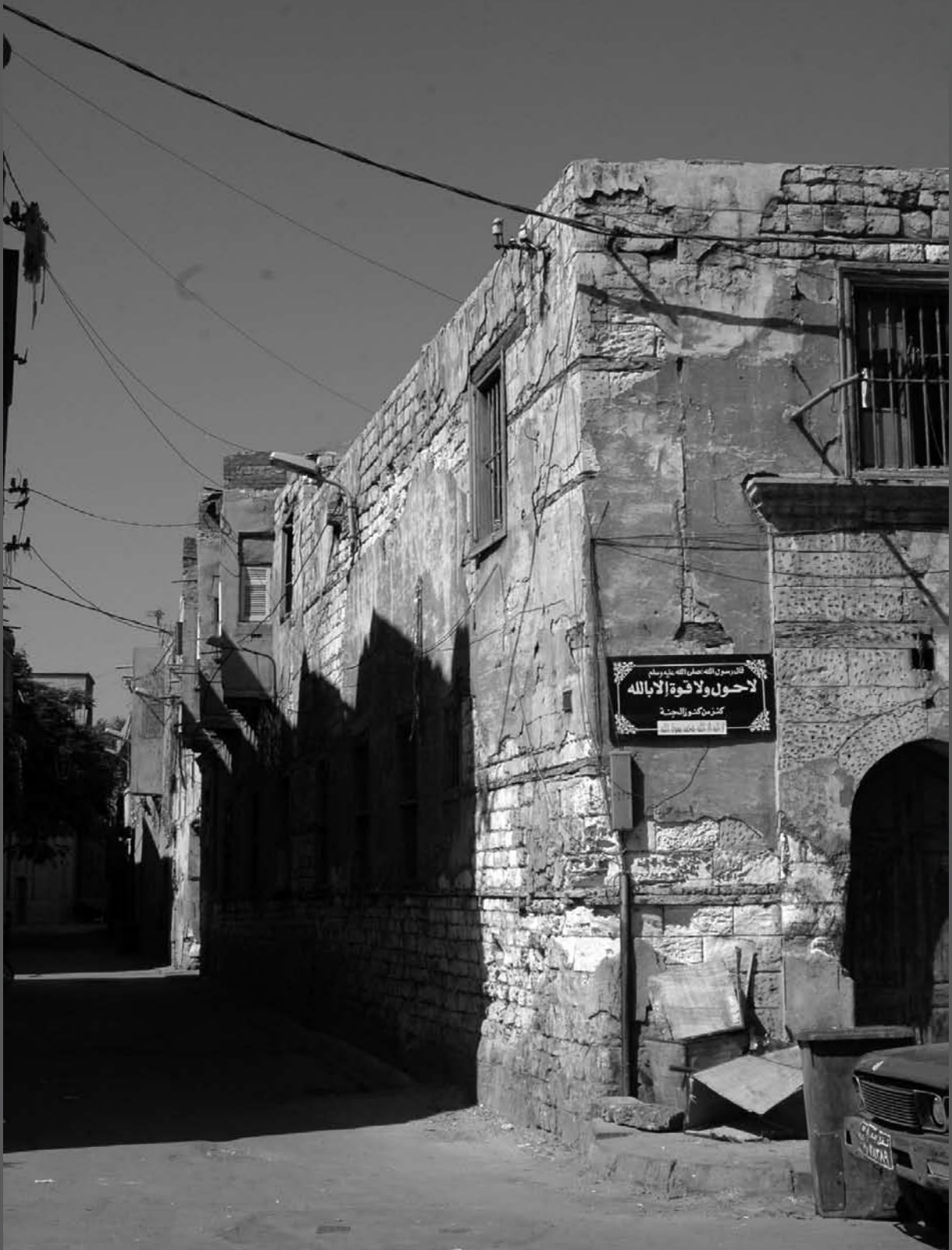
حمام المصري بشارع السبع بنات بقسم اللبان (شارع إبراهيم الأول سابقاً)