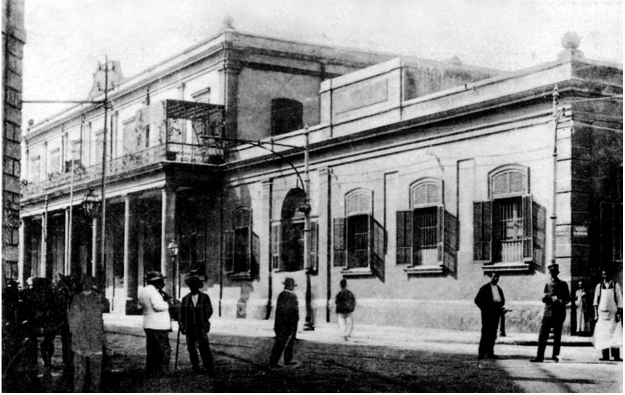
بورصة ميناء البصل عام ١٩٠٠م

لإفريقية، والرابع في تاريخ الدولة العبيدية (أي الفاطمية، نسبة إلى عبيد الله المهدي مؤسسها)، والخامس في تاريخ أهل صنهاجة (وهي إحدى القبيلتين الكبيرتين في الأقطار المغربية، والثانية هي قبيلة زناته، والصنهاجيون معظمهم جزائريون)، والسادس في تاريخ بني حفص أمراء الدولة الحفصية التي حكمت البلاد التونسية وأجزاء أخرى من المغرب العربي، والسابع والثامن في تاريخ الحكم التركي، أما خاتمة الكتاب فيتحدث فيها ابن أبي دينار عن الأحداث المتأخرة في البلاد التونسية، وقد طبع الكتاب في تونس عام ١٢٨٦هـ (١٨٦٩م) ونقله إلى الفرنسية (بيلسييه وريموزا Pellissier