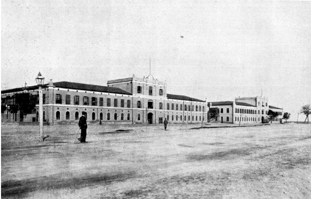
قصر مصطفى فاضل

٢٩١- أبو قير - شارع - بقسم الرمل (مصطفى باشا كامل حالياً)