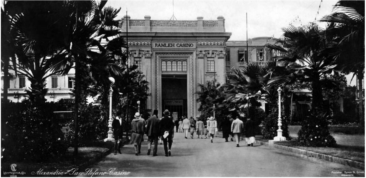
فندق سان ستيفانو

وأحمد شوقي، وحافظ إبراهيم، وخليل مطران (انظر مواد لطفي السيد وعبد العزيز البشري وأحمد شوقي بك وحافظ إبراهيم بك وخليل مطران)، وكان هؤلاء الأدباء والشعراء يتبادلون في اجتماعاتهم الأسبوعية الأحاديث الأدبية وال نوادر الطريفة والقصائد الرصينة والروايات الشعرية المستملحة، وقد نوه الشاعر خليل مطران بذلك المنتدى الثقافي في رثائه للآنسة مي فقال: