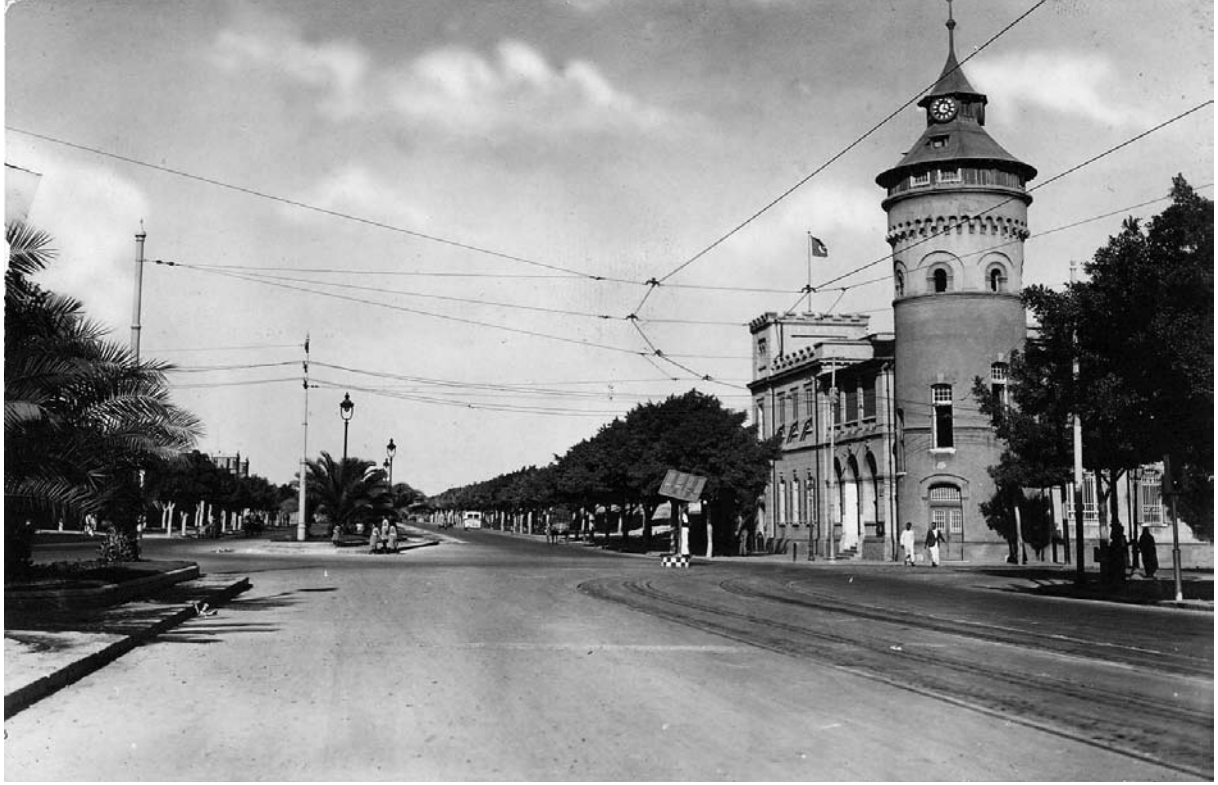
قسم باب شرقي

ودجيل اسم شارع بغداد كان ابن الجهم يقيم فيه ، وقد مات بسبب هذه الطعنة عام ٢٤٩ هـ (٨٦٣م) ، ومن شعره الذي نظمته عندما ذاق مرارة الفراق ولوعة الاغتراب هذه الأبيات الرقيقة: وَدَجِيلُ اسْمِ شَارِعِ بَغْدَادَ كَانَ ابْنُ الْجَهْمِ يَقِيمُ فِيهِ ، وَقَدْ مَاتَ بِسَبَبِ هَذِهِ الطَّعْنَةِ عَامَ ٢٤٩ هـ (٨٦٣ م) ، وَمِنْ شِعْرِهِ الَّذِي نَظَمْتَهُ عِنْدَمَا ذَاقَ مَرَارَةَ الْفِرَاقِ وَلَوْعَةَ الْاِغْتِرَابِ هَذِهِ الْاَبْيَاتِ الرَّيْقِيَّةِ: