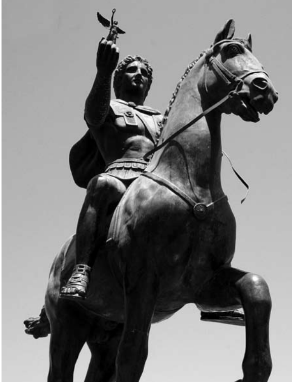
تمثال للإسكندر الأكبر بالمدينة (إهداء من الجالية اليونانية)

وهكذا تولى الإسكندر القيادة العليا للجيش اليونانية وأسرع في الزحف بجنوده على طيبة الواقعة في الجهة الغربية من أثينا، وأنزل بها الدمار بحركة جريئة بارعة كانت رادعاً كافيًا لغيرها من دويلات المدن التي كانت تقسم البلاد اليونانية وتضعف كيائها العام، وكان أصحاب هذه الدويلات الهزيلة يظنون أن الإسكندر يدرّب جنوده بالجبال فإذا هو يدهم أحد معاقليهم ويقضي عليه قضاء مبرماً، وكان هجومه المفاجئ الموفق في عام ٣٣٥ ق. م.