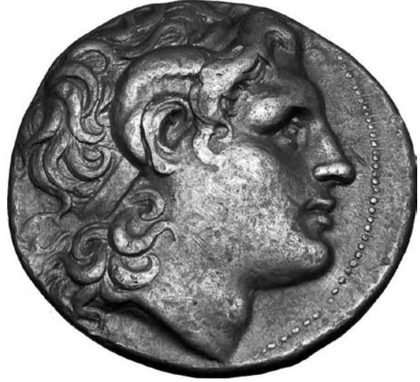
عملة فضية للإسكندر الأكبر

بيد أن هذا الزحف لم يتم إذ حدث اغتيال فيليب الثاني بيد قاتل يقول بعض المؤرخين أنه أحد أعوان «أولمبياس Olympias» الذي زوجته أم الإسكندر، وهي أميرة