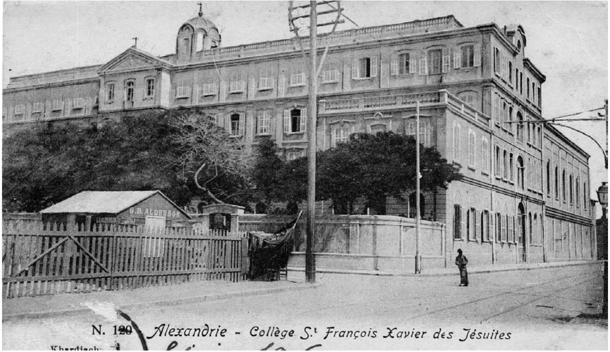
مدرسة الجزويت بشارع إسماعيل مهنا بقسم العطارين (مديرية الأمن حالياً)